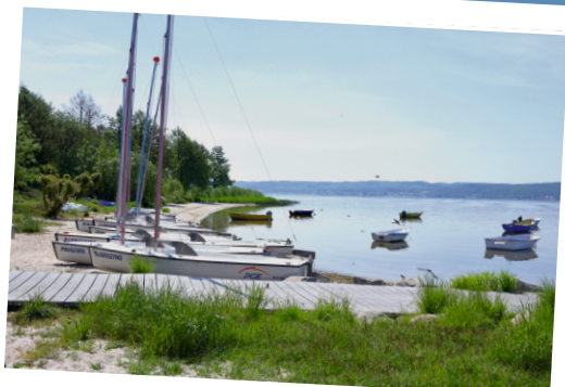
Postój łodzi w Lubkowie

* W przypadku ograniczonej liczby kadry szkoleniowej oraz niewystarczającej liczby osób niezainteresowanych kurs może zostać nieprzeprowadzony