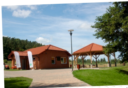
przystań w Brzynie

** uczniowie szkółki żeglarskiej prowadzonej przez Krokowskie Centrum Kultury w Krokowej, którzy już zdali Patent Żeglarsza Jachtowego mogą wypożyczać łódki klasy „Puck” za pół ceny (do 16 r. ż. realizują uprawnienia pod opieką osoby dorosłej, która posiada co najmniej Patent Żeglarsza Jachtowego).